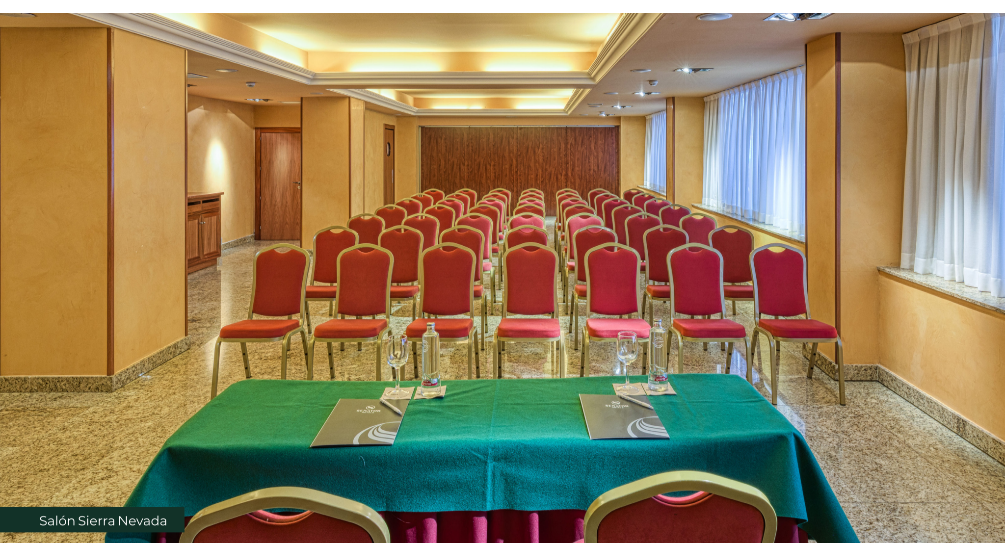
Salón Sierra Nevada