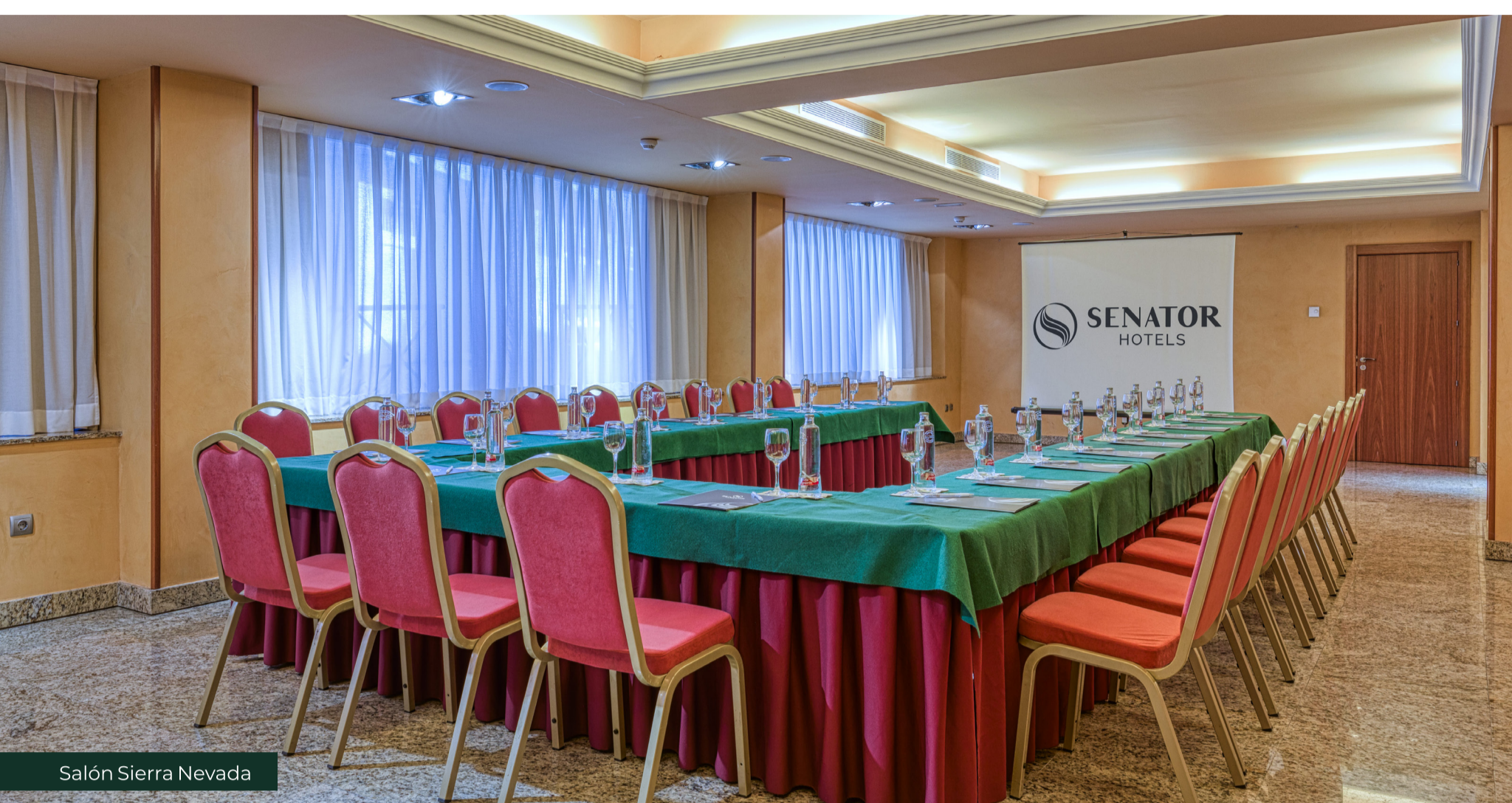
Salón Sierra Nevada